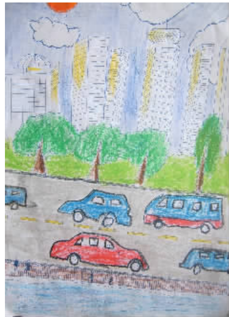
▲美丽的城市 ●香格里拉县第一中学168班何建军 指导教师和纪枫