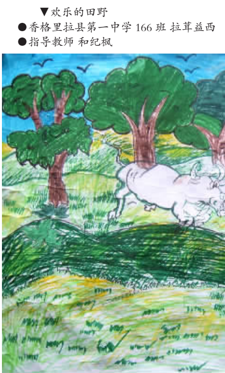
▼欢乐的田野 ●香格里拉县第一中学166班拉茸益西 指导教师和纪枫