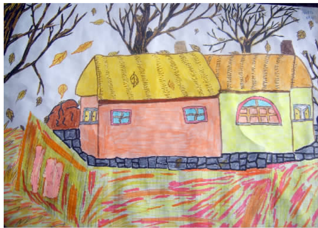
▲秋天里的家园 ●香格里拉县第一中学166班玛卓 指导教师和纪枫