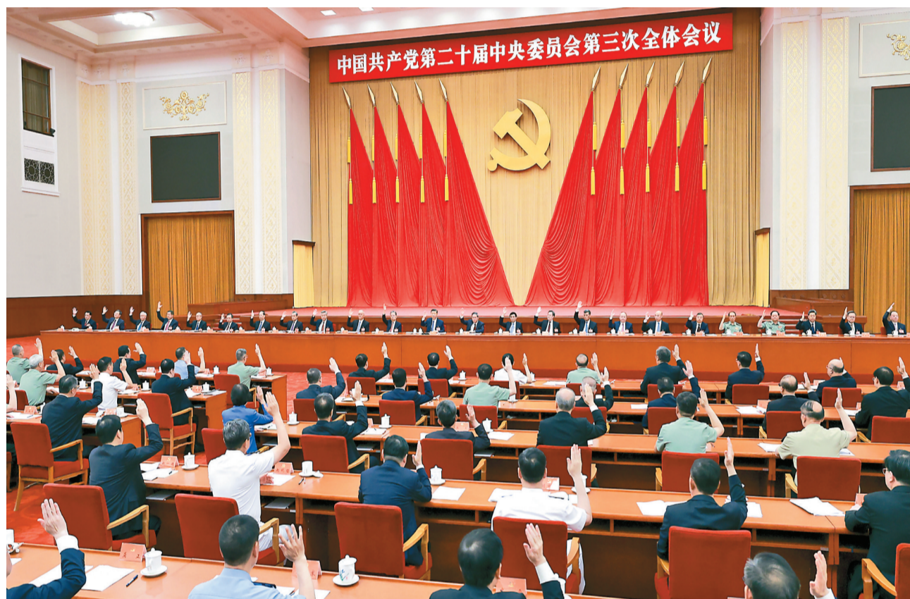
中国共产党第二十届中央委员会第三次全体会议，于2024年7月15日至18日在北京举行。中央委员会总书记习近平作重要讲话。