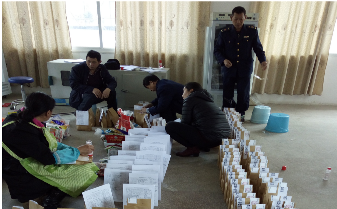
大春农作物种子备份样品封存。日前,维西县农科局种子管理站协同州种子管理站、县市场监督管理局农用物资管理科、云南良禾种业公司相关工作人员对2017年良禾种业迪庆分公司进维西销售的玉米种和水稻种进行封存。共封存玉米样品70个,代表数量438224.4公斤;水稻样品10个,代表数量17290公斤,保障种子销售质量,为种子质量纠纷案件调解提供鉴定依据。

“两学一做”学习教育基础在学,关键在做。地税局开展岗位大练兵活动,把党员带头做要求落到实处,每月集中学习2次,按季安排党员业务骨干带领大家系统学习,对业务学习做到全程监督,去年以来,全局共有37人参加业务考试,其中11名同志入选参加州局业务比武,1人入选省局参加业务比武。