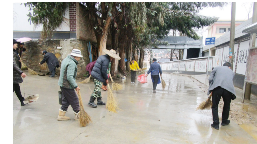
▲今年以来,维西县保和镇白鹤山社区抓住实施民族团结进步、边疆繁荣稳定重点项目契机,促进各民族共同团结奋斗、共同繁荣发展。图为白鹤山社区居民自觉走上卫生责任区打扫卫生。

为全面落实社会矛盾纠纷多元调处化解机制,塔城镇构建党委政府统一领导,维稳工作中心组织协调,人民调解、行政调解、司法调解相衔接配合的社会矛盾纠纷组织体系。按照《塔城镇贯彻落实〈人民调解法〉推进大调解工作格局实施方案》,强化矛盾纠纷大排查、大调处工作,着力构建了以人民调解为基础,人民调解、行政调解、司法调解联动的“三调联动”工作体系,推行“以案代补、以案定补”机制,推进人民调解进基层法庭、基层派出所,把调解优先原则贯穿到执法办案的各个环节。落实《维护保障群众权益“4+1”工作实施细则》,充分运用“4+1”工作法,依法、及时、有效地处理群众反映的问题,积极预防和妥善处置各类矛盾纠纷,维护社会和谐稳定。在矛盾纠纷的排查化解中,更加注重从源头上做好预防化解工作,深入