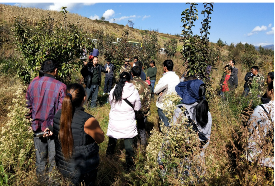
▲近日,维西县永春乡组织各村致富带头人及有意愿种植木梨的农户到保和镇兰永村古宗湾木梨规范种植基地开展木梨种植培训。培训分“看、尝、听”三个步骤进行。“看”主要让全体参训人员从木梨的色泽、饱满度等进行观察进一步了解木梨;“尝”则让参训人员品尝木梨味道;“听”让参训人员在木梨规范种植基地认真听取相关技术人员就木梨种植技术以及相关的病虫害防治知识。

借力专项纪律检查和抽查压实责任。该县要求所辖乡(镇)纪委要按照省、州、县有关要求及时确定抽查对象、深入贫困村检查、深入贫困户走访、及时填表造册、反