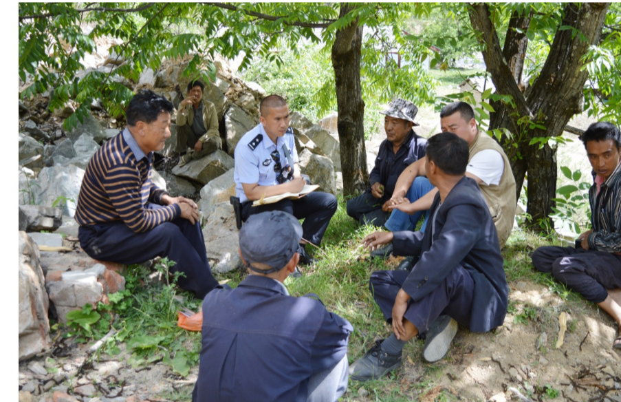
▲近年来,维西县塔城镇建立矛盾纠纷多元化解机制,促进社会和谐稳定。图为镇综治维稳中心组织相关部门人员到川达村罗中马组调解地基纠纷协调。

本报讯(记者 杨洪程)今年以来,维西塔城镇党委政府以踏石留印、抓铁有痕的精神认真落实《矛盾纠纷多元化解机制》《社会稳定风险评估工作机制和预警机制》,实现矛盾纠纷无历史积案、动态清零的目标,未出现群体性越级上访。