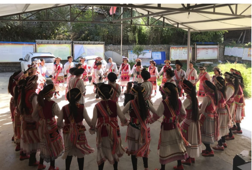
▲近日,维西县保和镇党委政府为传承和保护好“瓦器器”这项非物质文化遗产,分别在该镇罗马村、拉河柱村传习点开展“瓦器器”传习培训。培训邀请该县“瓦器器”非物质文化遗产传承人及相关工作人员进行指导培训。培训不仅让参训学员掌握了“瓦器器”十二脚的基本舞步,还为维西县非物质文化遗产的传承起到积极推动作用,还丰富了当地群众的业余文化生活。