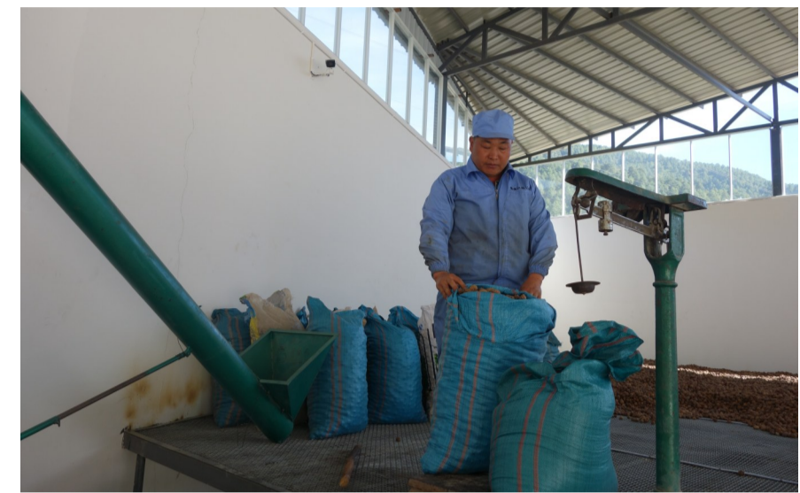
▲江德公司入驻维西中路乡特色产业园区以来,发挥农业龙头企业带动产业转型升级的作用,助力脱贫攻坚。因为公司正在收购核桃。(杨洪程 摄)