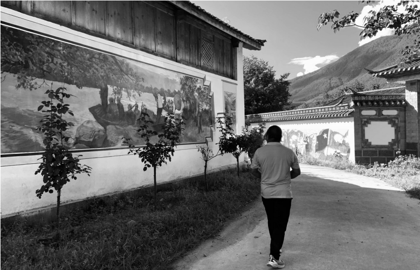
▲ 香格里拉市金江镇堆满一组是红二、六军团长征经过的地方。去年以来,堆满一组以建设美丽乡村为契机,在村道两旁种植玫瑰,在路旁墙壁上绘制红色文化墙画,营造了浓厚的红色美丽乡村氛围。

在民族文化生态保护实验区建设中,我州坚持“保护为主、抢救第一、合理利用、传承发展”的原则,注重民族文化整体性保护、抢救性保护和生产性保护,各县(市)相继成立了保护实验区建设领导小组,不断加强民族文化生态保护建设,加大传承人培养力度,积极推进传习设施建设,加强代表性项目和传承人保护。