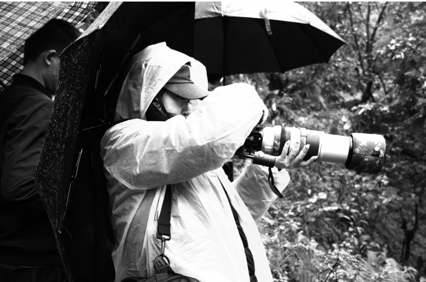
▲ 近日,许多摄影爱好者冒雨来到维西县塔城镇响古茅滇金丝猴观测点,用手中的相机记录下萌态十足的滇金丝猴。滇金丝猴群时而在林间觅食,时而打闹嬉戏,惹人喜爱,加之我州生态植被保护完好,响古茅群山叠翠、景色优美、空气清新,大家久久不愿离去。