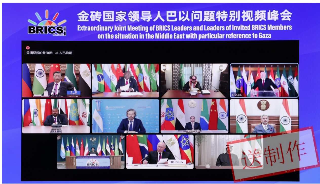
11月21日晚,国家主席习近平出席金砖国家领导人巴以问题特别视频峰会并发表题为《推动停火止战 实现持久和平安全》的重要讲话。