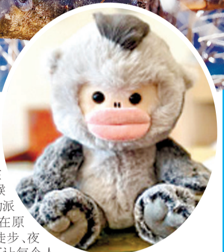
▶文创产品——滇金丝猴毛绒公仔。