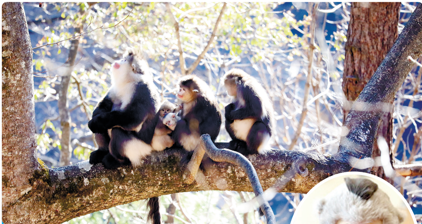
▲生活在维西县塔城镇响古箐的滇金丝猴。