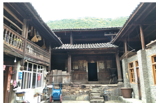
澜沧江畔黑日多杨湛英故居。